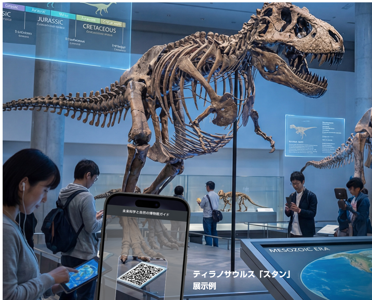
ティラノサウルス「スタン」 展示例