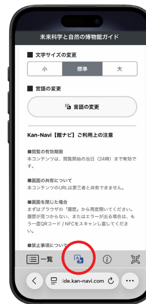
文字サイズ・言語の切り替え